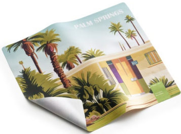
Ansicht des fertigen GripCleaner®

• Wir empfehlen diese Angabe aufgrund der Textilkennzeichnungsverordnung.